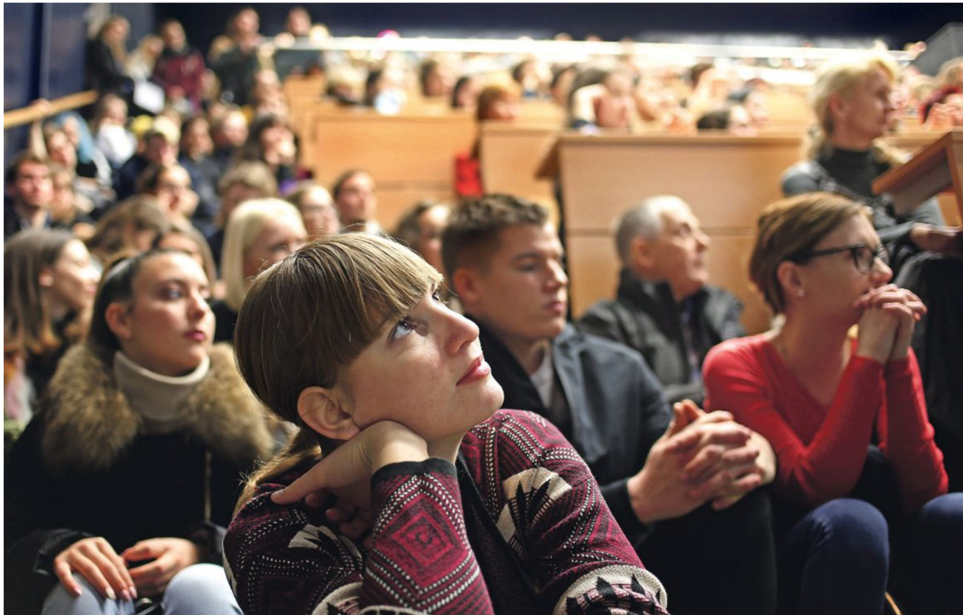
Najboljši delodajalci bodoče sodelavce snubijo že na fakultetah, najperspektivnejše talente spremljajo od drugega letnika in naredijo vse, da jih obdržijo.

Pred vrati delodajalca Dinamičnim, odprtim in učljivim se vrata lažje odprejo – kako ravnati, da bi pritegnili obetavne mlade?