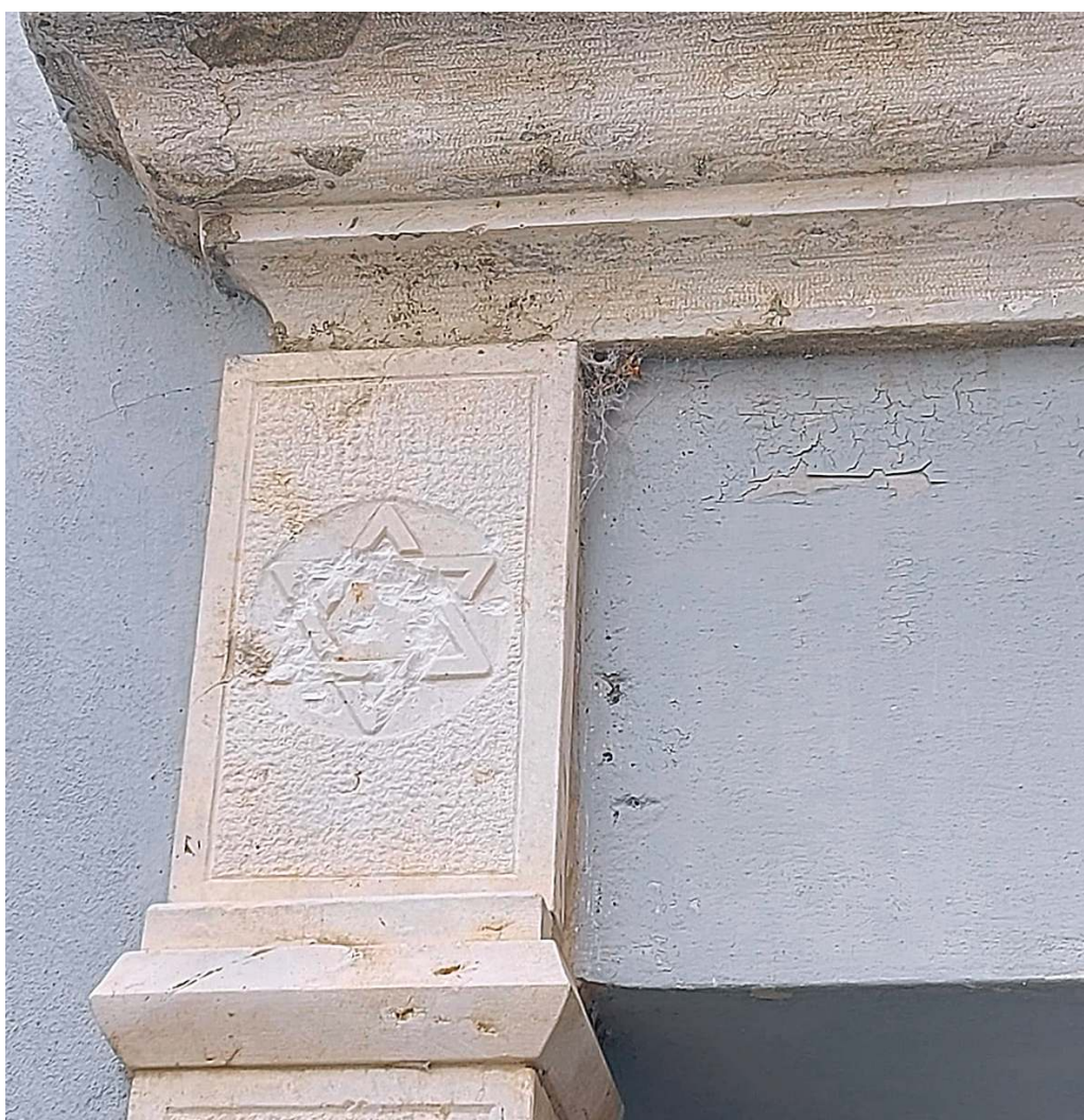
Na portalu na enem od vhodov v prehode na Židovskem trgu se je neznanec znesel nad vklesano Davidovo zvezdo.