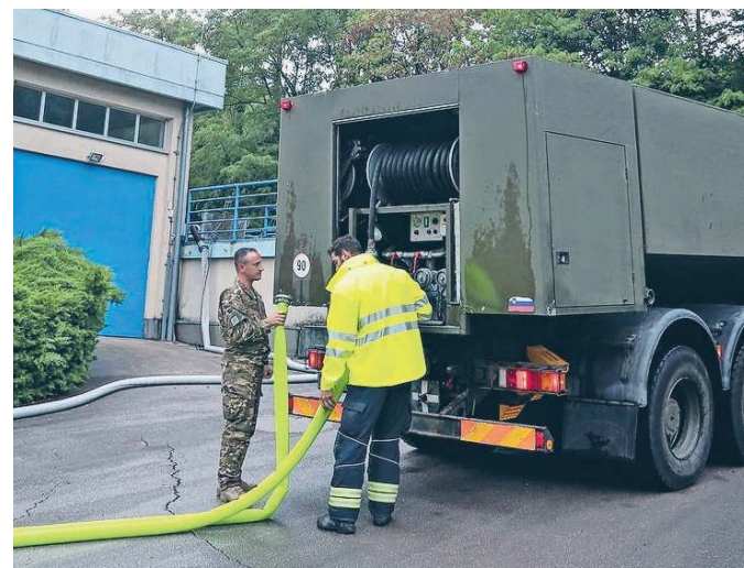
Letos se scenarij iz leta 2022, ko so pitno vodo morale dovažati cisterne, ne more ponoviti.